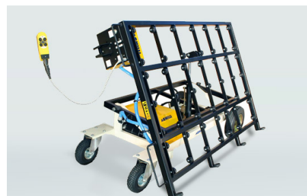
Carrello porta lastre SC500